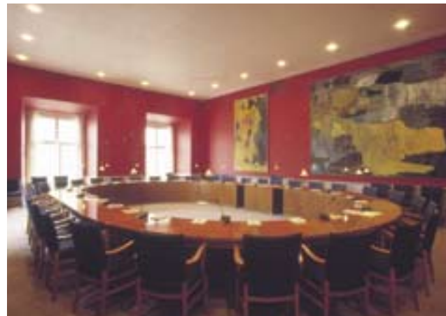
La salle de réunion de la Commission de la Politique extérieure décorée des toiles de Per Kirkeby

Tout d'abord, on est en droit de se demander comment reconnaître une question ayant « une portée » suffisamment grande « en matière de politique étrangère » pour faire obligation au gouvernement de se concerter avec la Commission de la Politique extérieure. Puisque l'initiative de consulter la commission appartient au gouvernement, c'est d'abord lui qui apprécie dans quelle mesure un projet de décision donné a « une grande portée en matière de politique étrangère ». Son appréciation repose sur plusieurs facteurs : en premier lieu