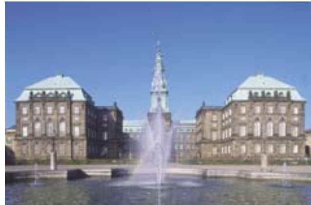
Le château de Christiansborg — siège du Parlement danois

En 2002, la Commission de la Politique extérieure s'est rendue aux USA et en Russie.