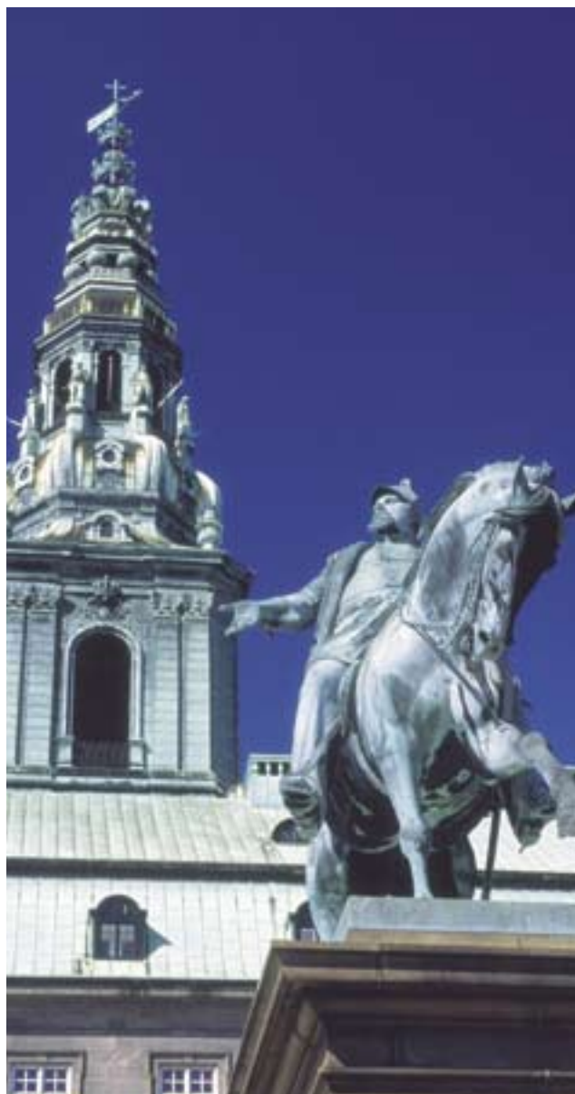
L'inspirateur de la Constitution, le Roi Frederik VII (1808-1863)

La saisine de la commission ayant lieu sur l'initiative de l'exécutif c'est, comme nous le disons plus haut, à celui-ci qu'il appartient en premier lieu de déterminer dans quelle mesure la portée d'un projet de décision est suffisamment importante pour nécessiter la convocation de la commission.