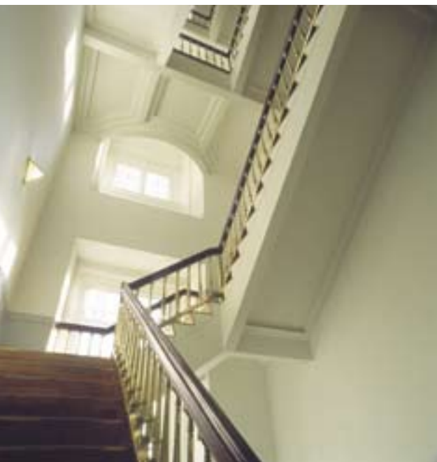
L'escalier de la Reine

sur une analyse de la question au plan international, ensuite en tenant compte des conséquences qu'aura la position du Danemark sur la question, enfin sur l'intérêt que peut avoir la question pour le Danemark.