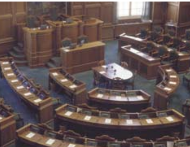
La Chambre du Parlement danois

Avant les réunions informelles des ministres des Affaires étrangères et des ministres de la Défense des États membres de l'Union européenne, le gouvernement consulte la Commission de la Politique extérieure (et ce, avant même de se présenter devant la Commission des Affaires étrangères) pour les questions de politique étrangère de portée majeure. Un compte rendu écrit est établi à l'issue de ces réunions.